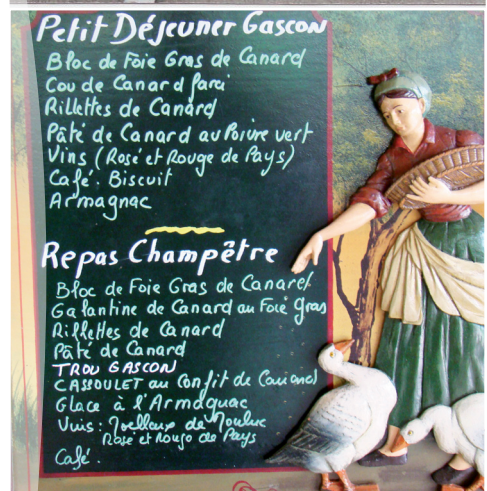
▲ Des menus diététiques ! Quatre nouveaux membres du Comité Macif offrent l'apéro. ▼

Nos retraités sportifs regretteront sans doute longtemps les rillettes de canard, les magrets, les garbures, les foies gras et autres cassoulets ainsi que la convivialité et la bonne humeur de l'ensemble des participants, mais toutes les bonnes choses ayant une fin, ils ont quitté avec regret le hameau des étoiles en se promettant de se retrouver prochainement pour de nouvelles aventures.